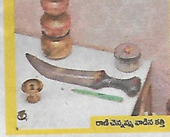
రాణి చెన్నమ్మ వాడిన కట్టి