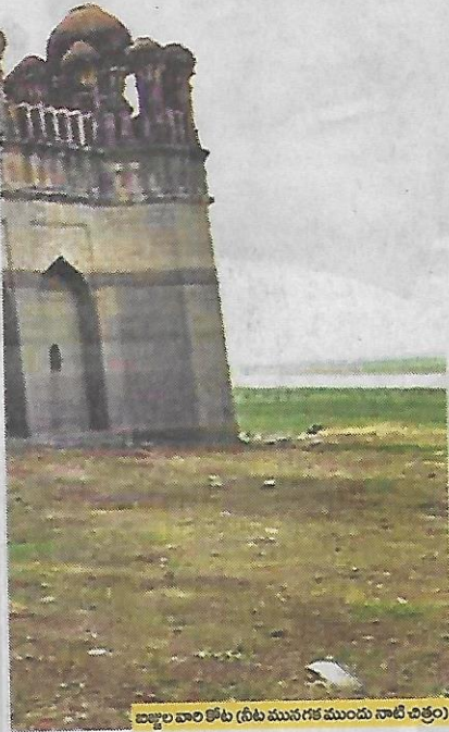
బాబుల వారి కోట (రీట మున గత ముందు నాటి చిత్రం)